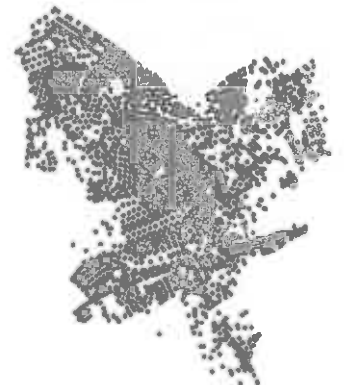
Egy lehetséges példa a járatrterv optimalizálására (optimalizált követő állapot)