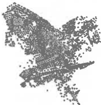
Egy lehetséges példa a járatrterv optimalizálására (Kiinduló állapot)